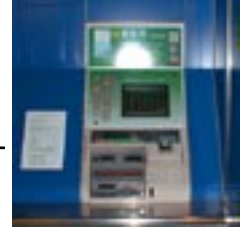
タッチパネル式券売機